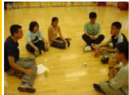
上圖：青年以遊戲體驗團體中的溝通和互相信任