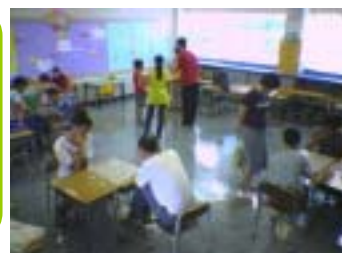
圖：棋藝比賽的情況