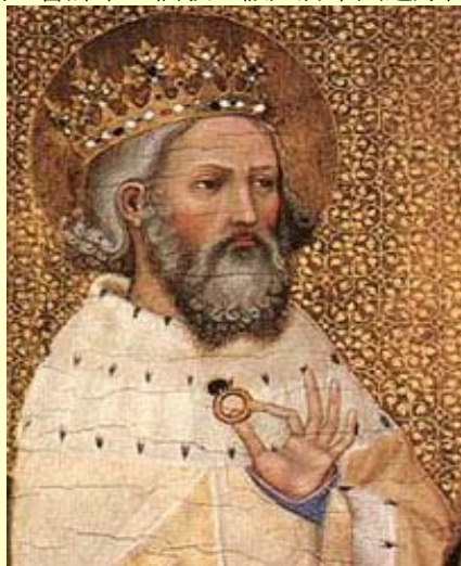
於英國倫敦國家美術館展出的聖愛德華像

教宗審判情形，宣佈愛德華王免除執行聖願的義務，但應將朝聖旅行所需的費用撥充善舉，並建造一所修院，奉伯多祿爲主保。