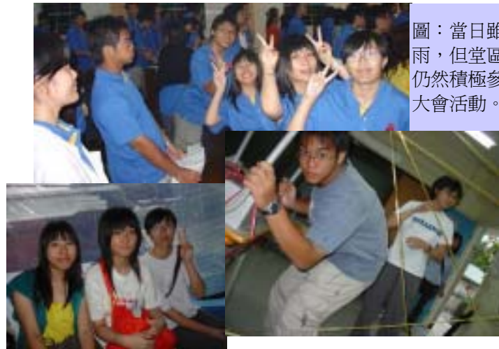
圖：當日雖然下雨，但堂區青年仍然積極參與大會活動。

還記得那天是下雨天，別說是烈日當空的天氣，要在山路泥地走來走去，去各個目的地，已經是十分辛苦的事，更何況是下雨天~汗水和雨水都溶合在一起，還要走斜路，行泥路水"沘"，又要顧著撐傘子，又要顧著濕滑的路。在這艱辛的環境下，我組的組員與組員之間，也能發揮互助的精神。透過這次活動，能令我與組員之間的友情增進不少，也學會互相幫助的重要。