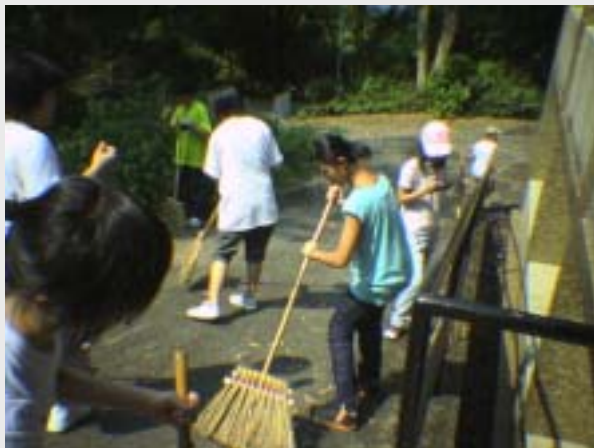
上圖：青年正埋頭苦幹為修院打掃 左下：修院古老而莊嚴的聖堂

在拜苦路和午膳後，堂區青年們參加了與一些愛德服務的工作。我們堂區青年的工作，是要打掃飯堂