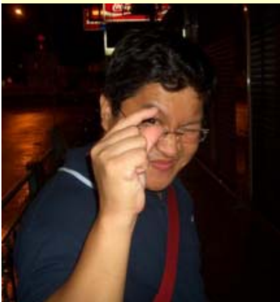
「我是一個充滿喜樂的人，希望能夠和大家分享這份源自信仰的喜樂！」

方神父最後補充：「我是一個充滿喜樂的人，希望能夠和大家分享這份源自信仰的喜樂！」